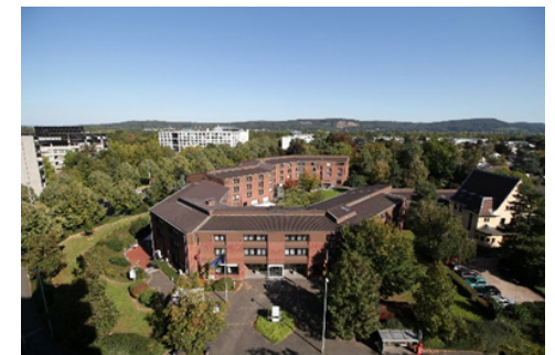
Das GSI in Bonn.